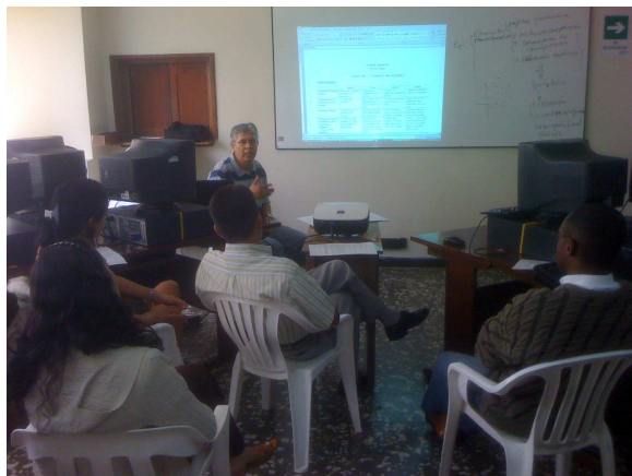
Figura 2. Seminario con profesores sobre la EpC.

forma como se le presenta al alumno y la propia comprensión del docente juegan un rol fundamental al poner el conocimiento que se quiere impartir a los alumnos.